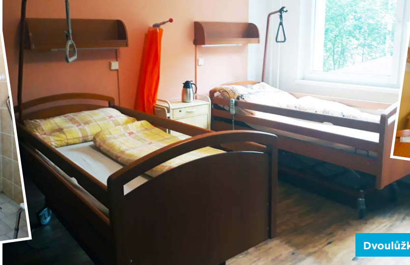
Dvoulůžkový pokoj na OPS