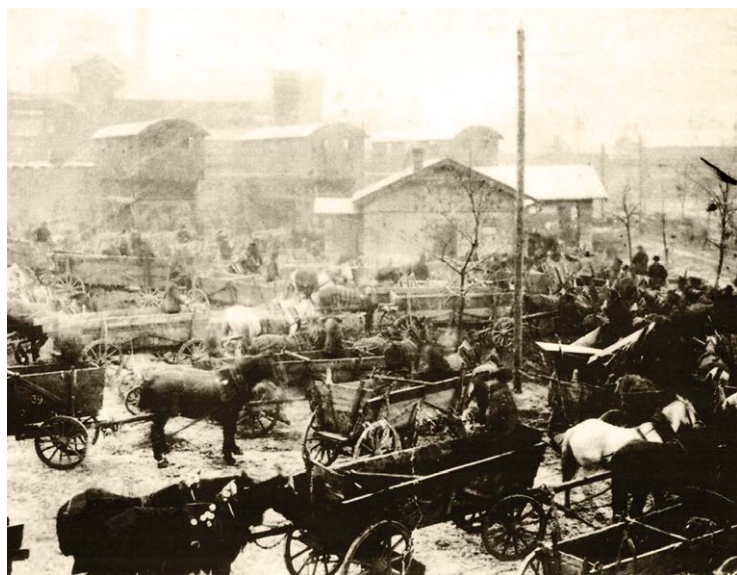
Nádvoří Dolu Trojice s povozníky čekajícími na uhlí