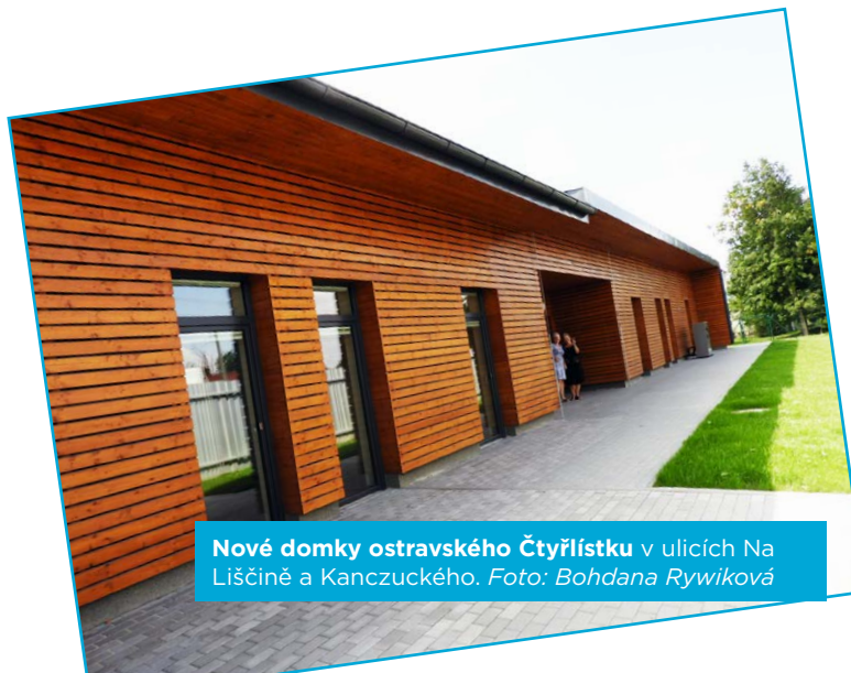
Nové domky ostravského Čtyřlístku v ulicích Na Liščině a Kanczuckého.