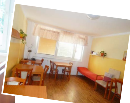
Jídlna, která slouží také jako společenská místnost