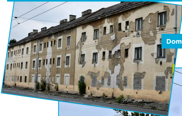
Domy před demolicí.