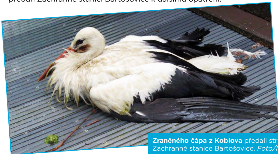
Zraněného čápa z Koblova předali strážníci do Záchrané stanice Bartošovice.

Na základě oznámení byla 19. srpna vyslána hlídka městské policie do Koblova. Zde se nacházel zraněný čáp, který byl nejprve převezen do útulku a následně předán Záchrané stanici Bartošovice k dalšímu opatření.